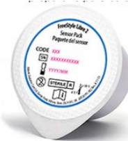
ENVASE SENSOR (NO reutilizable)